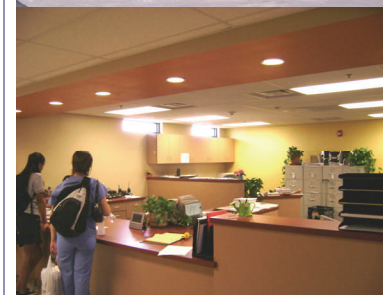
El espacio remodelado de la Escuela Littleton transformado en la nueva oficina.