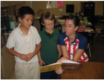
Todos los alumnos participaron activamente en actividades de aprendizaje.