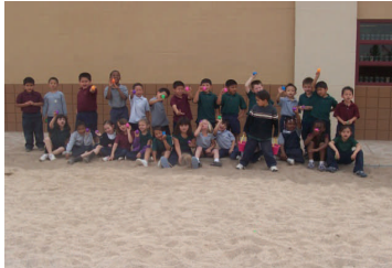
Kinder Camp fue creado para proporcionar información a padres de alumnos que van a entrar al kínder y para que los niños se sientan cómodos con la escuela y sus maestros.